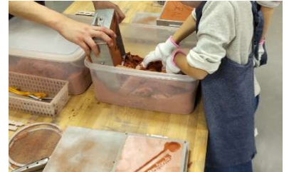
スズが固まったら型から外してヤスリ等で仕上げで完成!