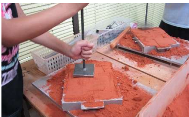
型枠にバングル原型を置き鑄物砂を詰めます。