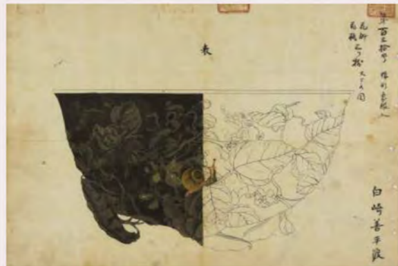
豆に蝸牛文花斛下絵(大橋家下絵)