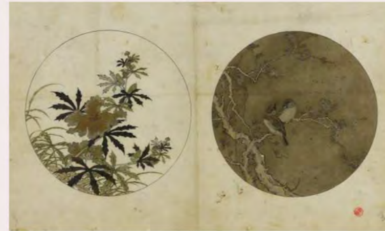
花鳥文扁壺形花瓶下絵(金森家下絵)