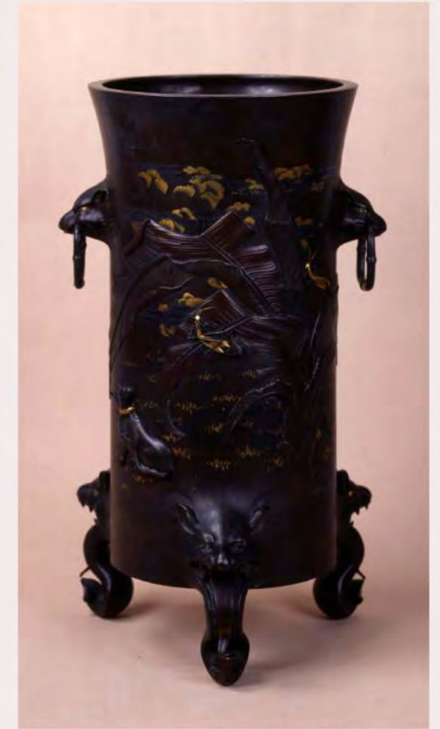
室江吉兵衛(金銀銅象嵌芭蕉に猫文花器)(高岡市美術館蔵)