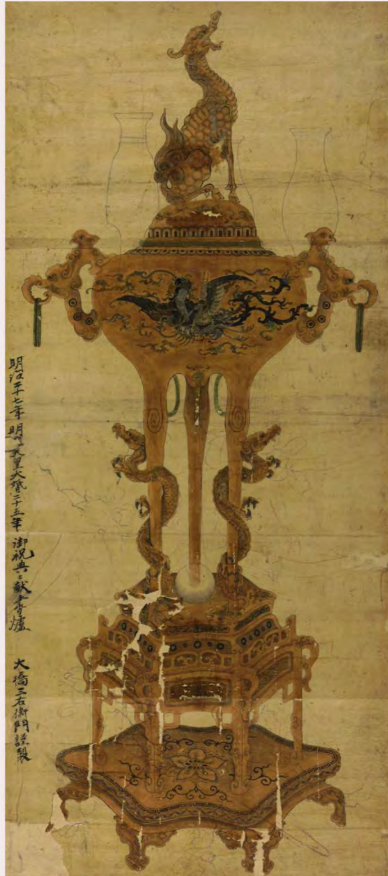
古銅龍巻香炉下絵(大橋家下絵)

富山県高岡市の伝統的工芸品である高岡銅器の歴史は江戸初期の高岡開町とほぼ同時にはじまります。