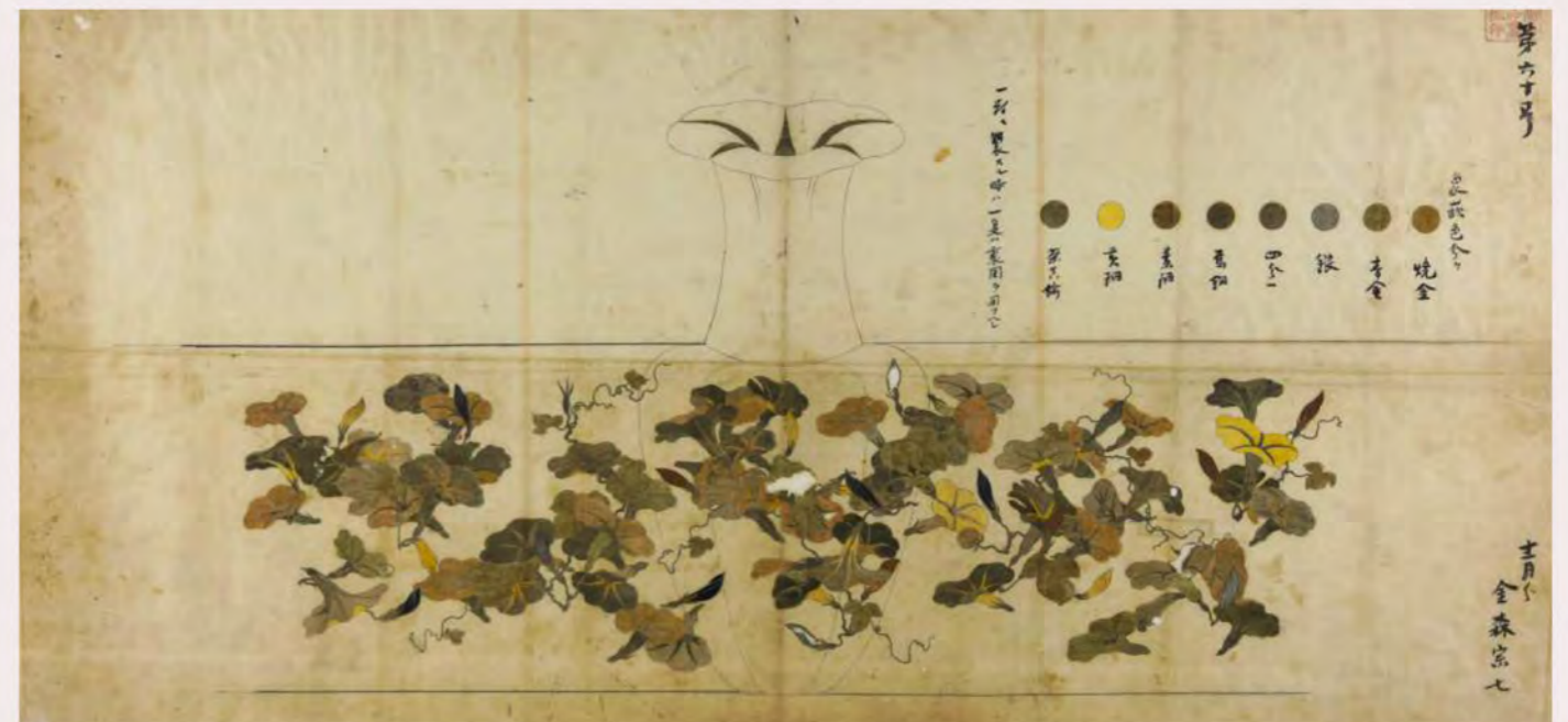
散朝顔文象嵌花瓶下絵(金森家下絵)