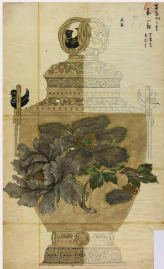
牡丹文壺下絵(大橋家下絵)