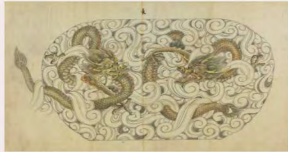
雲龍文図(大橋家下絵)